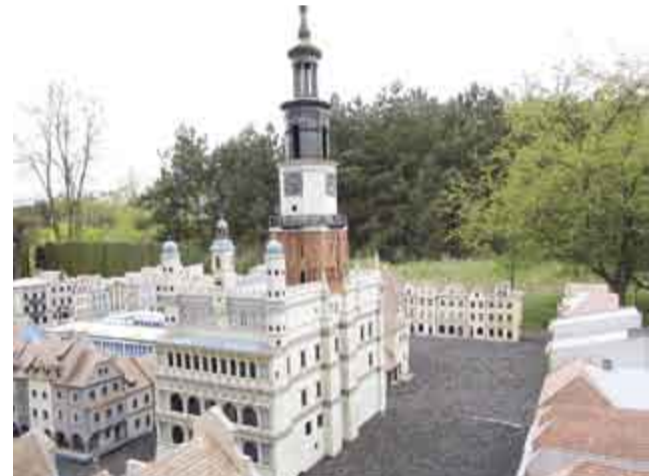
↑ Skansen Miniatur w Pobiedziskach - makieta Starego Rynku w Poznaniu;

Ostatnim etapem zwiedzania był Skansen Miniatur w Pobiedziskach, położonych na Szlaku Piastowskim, pomiędzy Gnieznem a Poznaniem. Skansen otwarto w 1998r. w roku jubileuszu 950-lecia Pobiedzisk. Na terenie Skansenu zlokalizowanych jest 100 miniatur budowli Szlaku Piastowskiego i Wielkopolski, wykonanych w skali 1:20. Obecnie znajdują się m.in. Pałac w Rogalinie, Stary Rynek w Poznaniu, Katedry w Poznaniu i w Gnieźnie, zagroda wiejska w Biskupinie, Biblioteka Raczyńskich, Opera