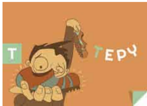
TEPY - korki, buty piłkarskie