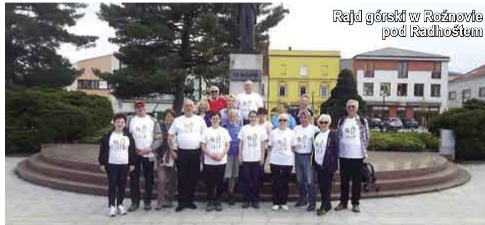
Rajd górski w Rożnowie pod Radhośćem