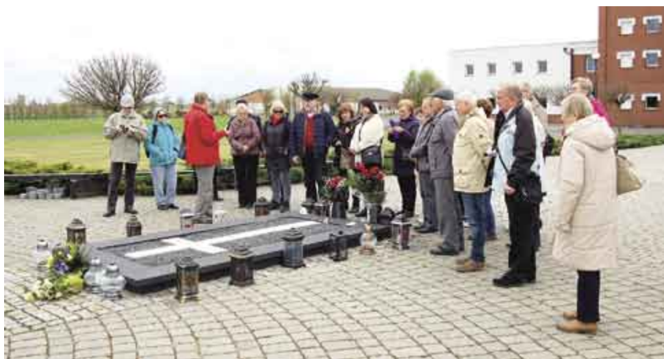
↑ Przy grobie O. Jana Góry na polach Lednickich;