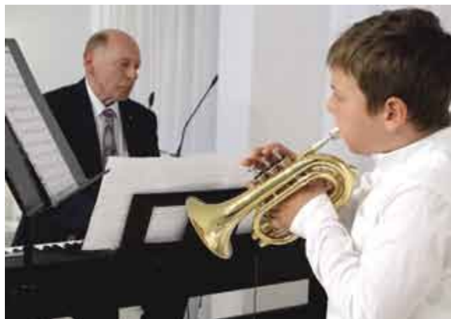
↑ Koncert uczniów szkoły muzycznej w bibliotece