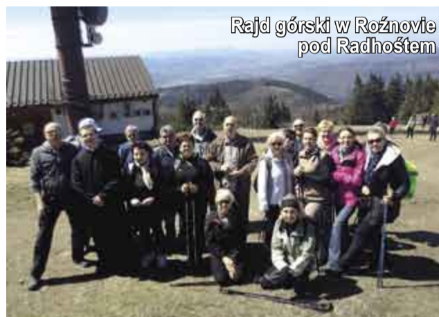
Rajd górski w Rożnowie pod Radhośćem