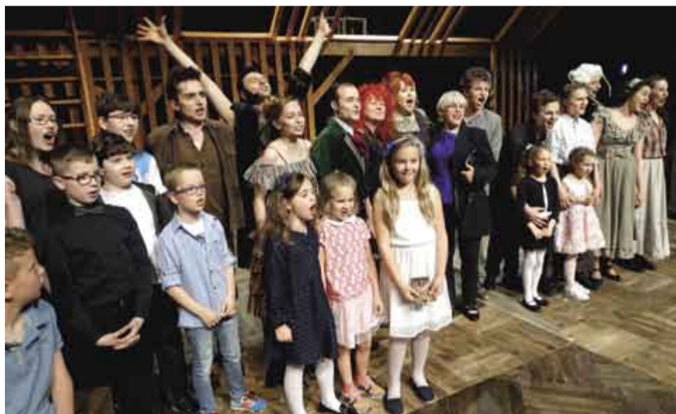
↑ Tajemnica Tomka Sawyera - zdjęcie z aktorami