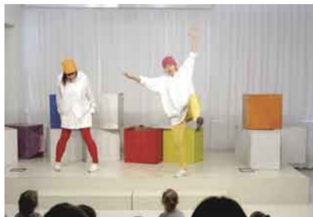
↑ Spektakl „Blumowe piosenki” Teatru Blum