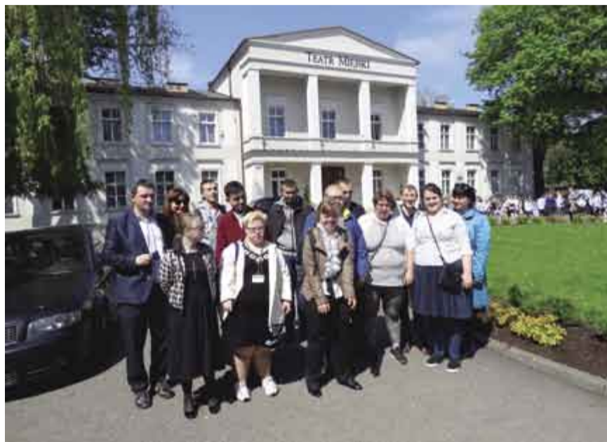
↑ Uczniowie ZSS przed Teatrem Miejskim w Lesznie

Biblioteka Publiczna w Śremie na Tydzień Bibliotek przygotowała atrakcyjny program, z którego skorzystało ok. 900 czytelników w każdym wieku (fotorelacja).