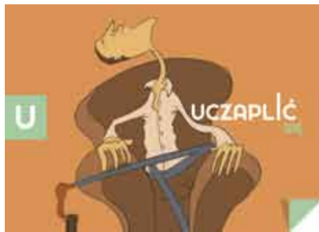
UCZAPLIĆ SIĘ - rozsiaść się wygodnie