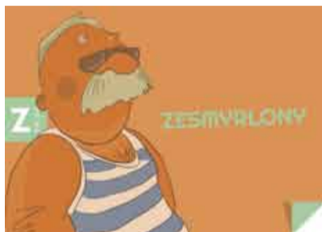
ZESMYRLONY - opalony