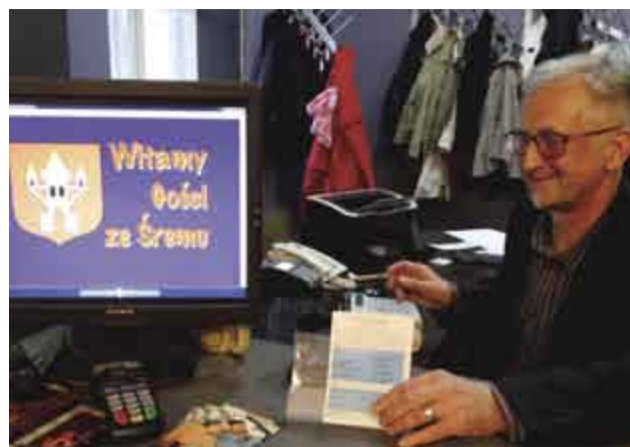
↑ Wyjazdy do Teatru Miejskiego w Lesznie (5 wyjazdów)