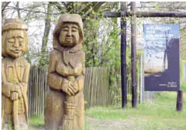
↑ Przed wejściem do Wielkopolskiego Parku Etnograficznego w Dziekanowicach;

Kolejnym miejscem zwiedzania było Muzeum Pierwszych Piastów na Lednicy, które pierwotnie opiekowało się tylko ruinami na wyspie Jeziora Lednica, na którą przepływa