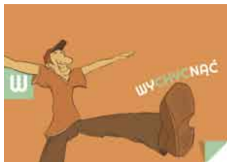
WYCHYĆNAĆ - wyskoczyć