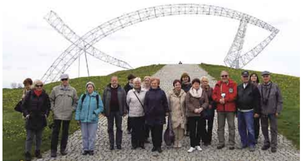
↑ „Warcianie” po przejściu pod Rybą na Polach Lednickich;