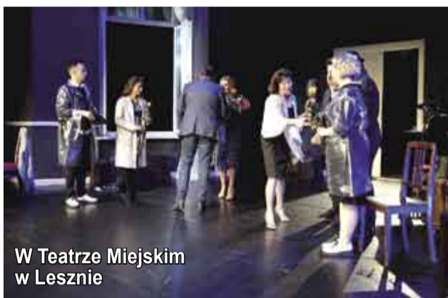
W Teatrze Miejskim w Lesznie

Kolejnym dużym wydarzeniem turystycznym w dniach 29 kwietnia - 6 maja, był rajd górski w którym uczestniczyło 20 osób, które udały się do Rożnowa pod Radhośćem, naszego partnerskiego miasta. Mniej licznie, ale za to co tydzień, wybieraliśmy się również na wyieczki rowerowe.