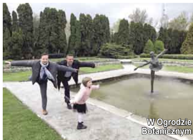
W Ogrodzie Botanicznym