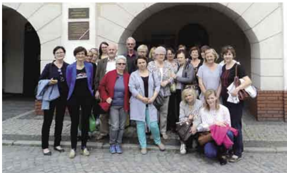
↑ Wyjazd dla bibliotekarzy i emerytów do Jarocina