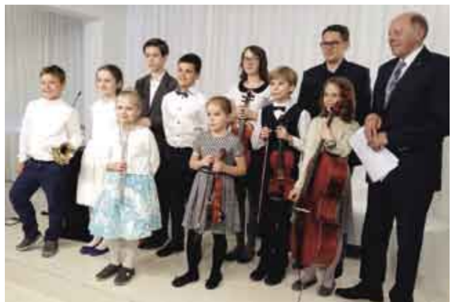
↑ Uczniowie Katolickiej Niepublicznej Szkoły Muzycznej w Śremie z nauczycielami