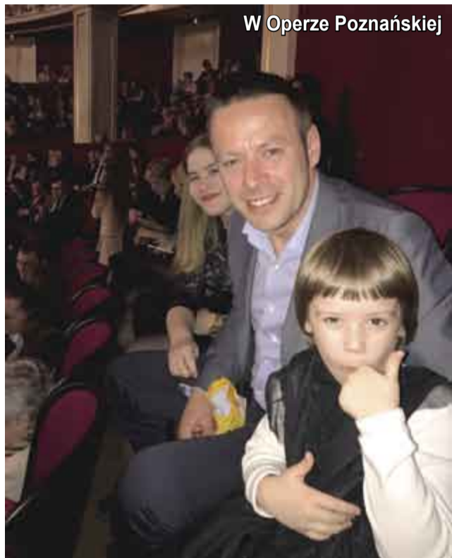
W Operze Poznańskiej

18 marca w Puszczy Zielonocze Zarząd Oddziału uczestniczył w wyborach do Zarządu Wojewódzkiego PTTK. Dużym