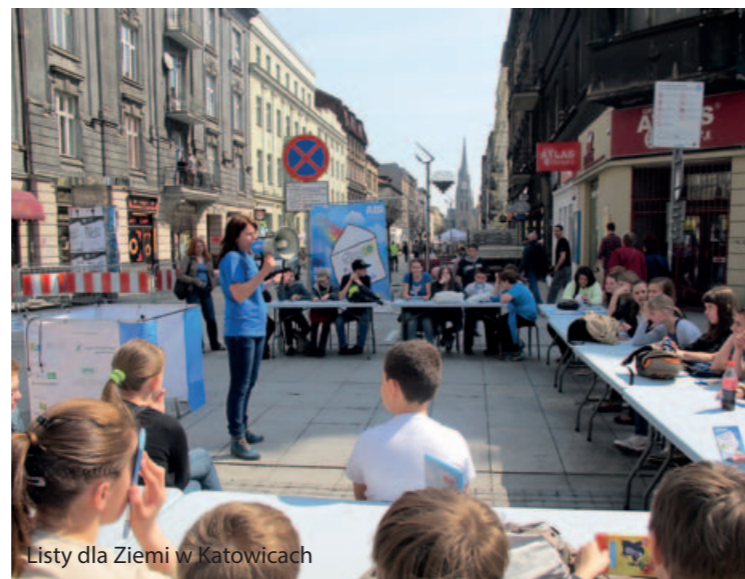
Listy dla Ziemi w Katowicach