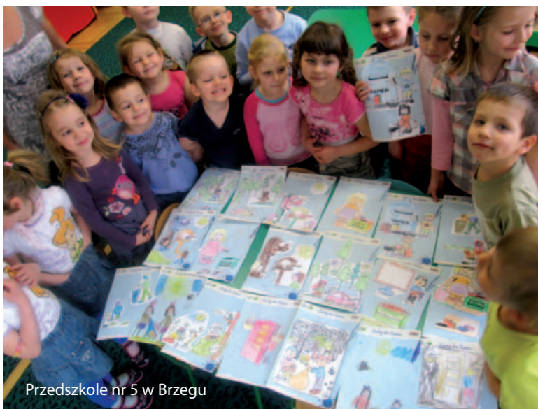
Przedszkole nr 5 w Brzegu