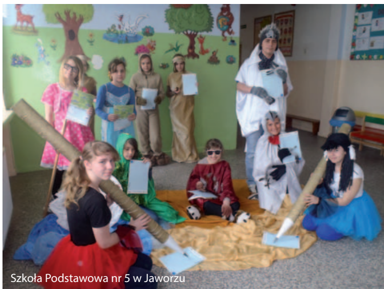
Szkoła Podstawowa nr 5 w Jaworzu

Zapraszamy do udziału w konkursie na inicjatywę Listy dla Ziemi 2014