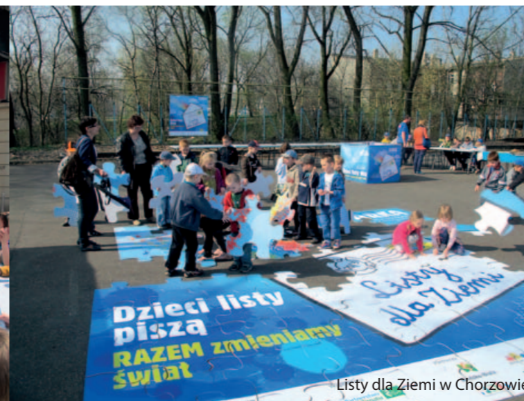
Listy dla Ziemi w Chorzowie