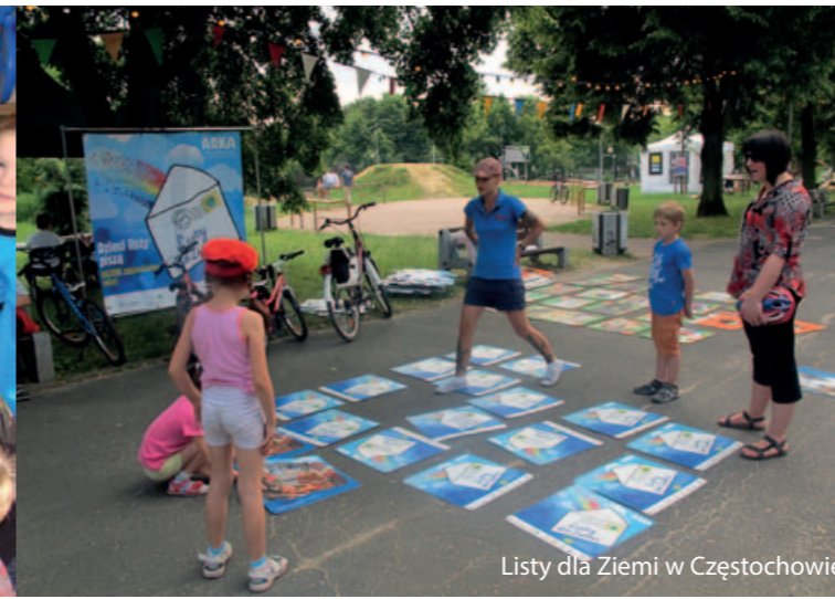
Listy dla Ziemi w Częstochowie