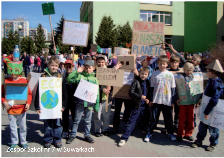
Zespół Szkół nr 7 w Suwałkach