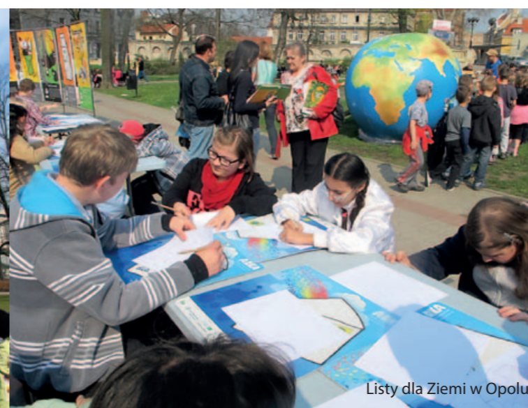
Listy dla Ziemi w Opolu

Dane pochodzące z pomiarów jakości powietrza są zatrważające. Dla przykładu od października 2012 roku do końca lutego 2013 roku w województwie śląskim było tylko 31 dni bez przekroczenia dopuszczalnego poziomu zanieczyszczeń powietrza!