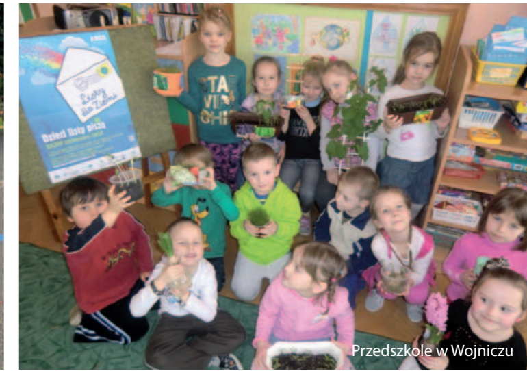
Przedszkole w Wojniczu