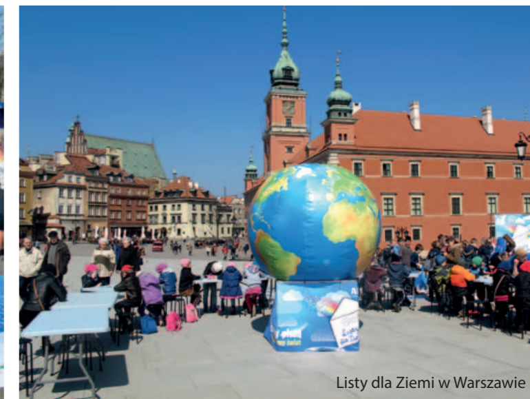
Listy dla Ziemi w Warszawie