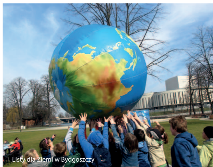
Listy dla Ziemi w Bydgoszczy