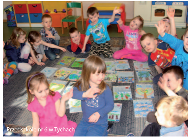
Przedszkole nr 6 w Tychach